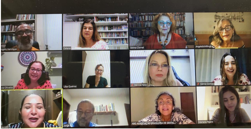
imagem da reunião de transição das diretorias, ocorrida em janeiro, via plataforma Zoom e com a participação de todas (as) os (as) membros das duas diretorias

5) Criar núcleos com a participação de associados visando à formação de redes e tendo em vista à ampliação da atuação da Gestalt-terapia, inicialmente dentro das seguintes temáticas: Relações raciais, Relações de gênero e diversidade sexual, Classe e desigualdade social, Ambientalidade; 6) Discutir amplamente com a comunidade gestáltica diretrizes gerais para a formação em Gestalt-terapia, a partir de um processo participativo, envolvendo discussões e debates, finalizando com a indicação de diretrizes referendadas em assembleia; 7) Ampliar o "Boletim da ABG", buscando formas de divulgar atividades e informações pertinentes à comunidade gestáltica. Ampliar fronteiras, nutrindo o contato e a diversidade é o maior propósito dessa gestão que, amparada pelos trabalhos realizados com muito afincamento desde o início da associação, prezar pelo desenvolvimento, aproximação, comunicação e cuidado com nossa querida abordagem e comunidade. A reunião de transição foi um momento histórico, marcada por emoção, histórias de luta, saudade e desejos para uma continuidade holisticamente saudável da ABG : "A gestão que iniciamos agora tem